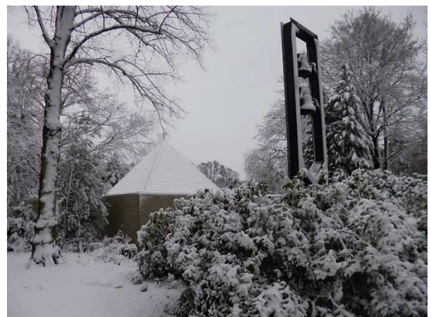
Kapel van St. Paul 'bij uitzondering' één dag in winter-tooi.