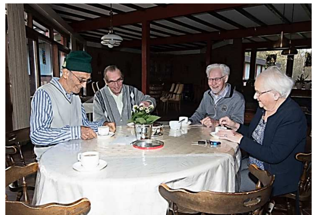
Weer thuis op St. Paul bij medebroeders en familiekring.