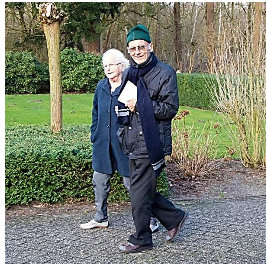
Aankomst op St. Paul terug naar zijn Mariannahiller grondslag .

Hij woont nu in het Missiehuis St. Paul, deze gemeenschap is gegroeid tot 8 leden.