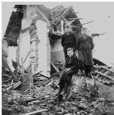
Drie studenten op de puinhopen van het klein-seminarie in Blitterswijk

Bij Oldenzaal reed de trein over de Nederlandse grens. Ze hadden besloten zich niet bij de verantwoordelijke instanties aan te melden, maar in kleine groepen uit elkaar te gaan om zodoende gemakkelijker onderdak te vinden en aan razzias te ontkomen. De medebroeders die van het noord-westen van Holland afkomstig waren namen afscheid en probeerden een weg naar thuis te vinden. Een andere groep samen met degenen die uit het zuiden kwamen vonden een onderkomen bij de Dominikanen in Zwolle. De overigen reisden vandaar verder naar Groningen en Friesland.