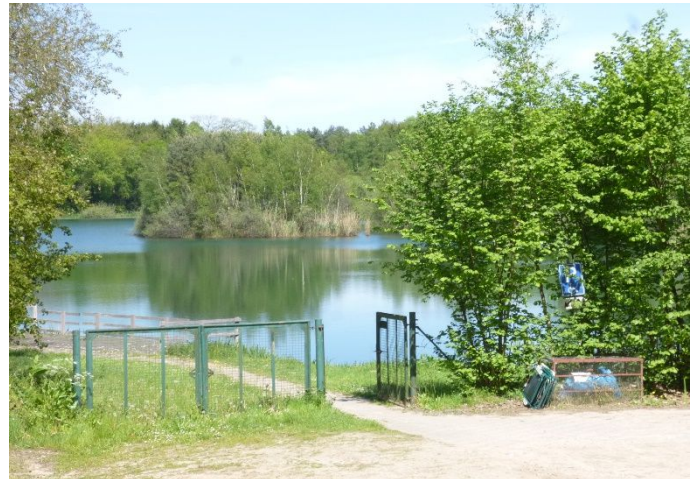
Een voormalige zandgroeve