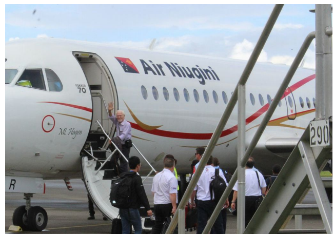
Vertrek van Lae Airport

Pater Sido is te voet, per auto en per boot naar menige kleinere plaatsen in de Morobe provincie gereisd zoals de Siassi eilanden, Situm, Gobari, Gusap, Menyamya en Erap, om het Evangelie te verspreiden en de zieken te helpen.