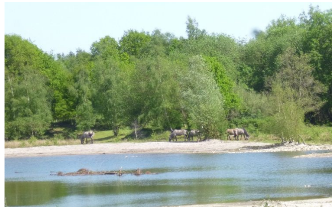
Half-wilde paarden ontbreken niet

Het vakantiepark van St. Paul dat oorspronkelijk als Veldkamp Stichting in 1969 begon heeft zich als Franz Pfanner Stichting verder ontwikkeld en werd in 2004 door het vakantieparkenbedrijf ‘De Roompot’ overgenomen. Behalve 500 bungalows voor vakantiegangers staan er honderden caravans waarvan de meesten een vaste standplaats hebben; een ander terrein is beschikbaar voor campingwagens. In de directe omgeving van het oorspronkelijk Mariannahiller gebied dat nu een vakantie-terrein is ligt een fraai natuurgebied met bossen en talrijke kleinere plassen die door intensieve zandgraverij zijn ontstaan. De Stichting Limburgs Landschap heeft het grootste gedeelte van dit gebied onder zijn beheer en werkt voortdurend aan verfraaiing van dit natuurpark. Er zijn in dit stiltegebied aan beide zijden van de grens met Duitsland talloze fiets- en wandelpaden door de bossen en langs de waterplassen met rustieke rustplaatsen. Bij grenspaal 500 is een stuk bos waar jaarlijkse groepen scout boys hun tenten opslaan.