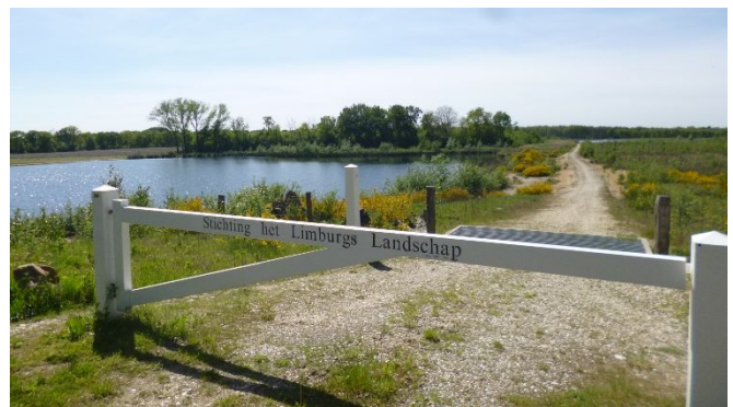
Onder beheer van de Stichting Limburgs Landschap