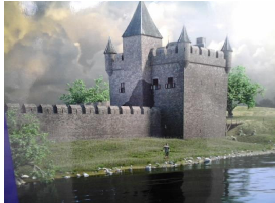
Schets van de oorspronkelijke vesting 'De Schans' van Arcen rond 1500...