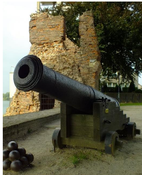
...en wat er vandaag nog van te zien is