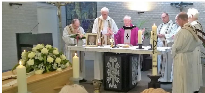
De uitvaartmis met concelebrerende Mariannahillers