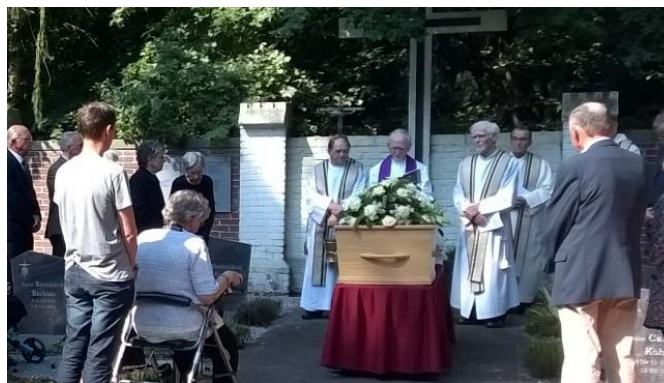
Op het kerkhof van St. Paul