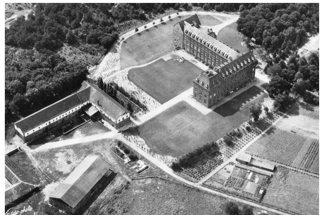
Paul in de bloeitijd: een staatje op zich