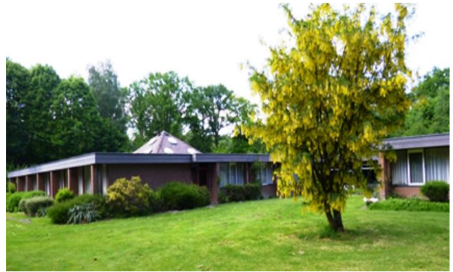
St. Paul sinds 1974

Mariannahill in Nederland Info NL 24/maart 2018