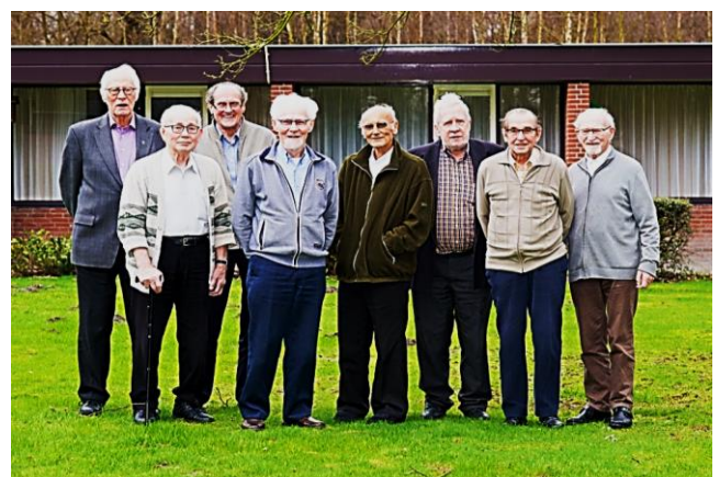
Na gedane arbeid... 2018vv