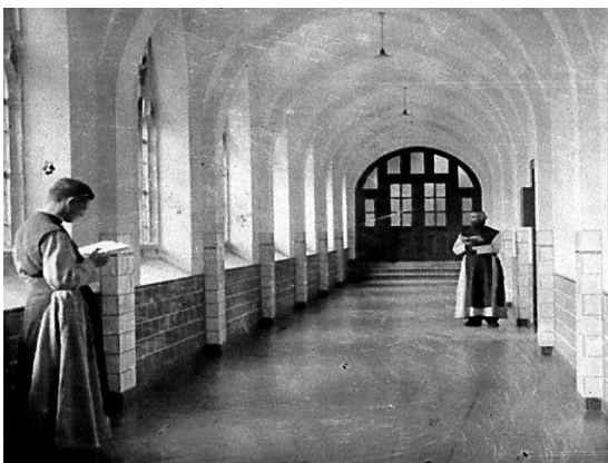
1911-20 Overgangperiode van monnik tot missionaris