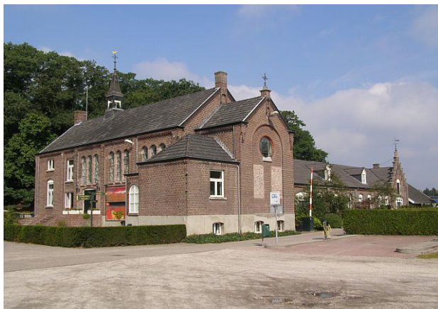
1911 Eerste St. Paul nog in stand.

Mariannahill in Nederland Info NL 24/maart 2018