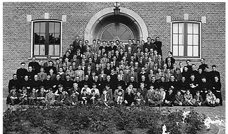
Een overbevolkt huis rond 1950