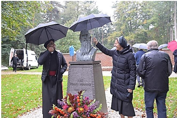
Borstbeeld van Abt Pfanner, een repliek van een beeld in het door hem in 1869 gestichte klooster in Kroatië

Daarom wordt volgens een oude traditie bij het begeleiden van een overledene naar het kerkhof het aloude ‘In paradisum’ gezongen, ‘naar het paradijs mogen engelen je begeleiden naar het hemelse Jeruzalem,’ de onmetelijke ruimte van de Heilige, niet ontstaan door een ‘oerknal’.