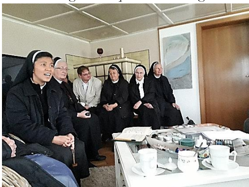
Zusters van het Kostbaar Bloed bij een koffie-uurtje in de woonkamer van het geboortehuis van hun stichter