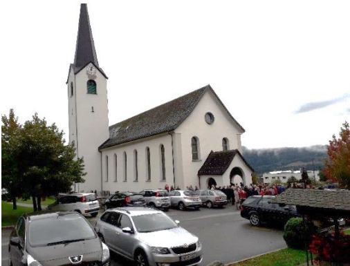
Viering in de dorpskerk van Langen