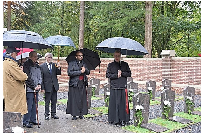
Zegening van de graven

Het kerkhof van St. Paul in Arcen werd aangelegd in 1913 naar aanleiding van de eerste overledene van de jonge gemeenschap van het missiehuis dat nog in aanbouw was. Met de oprichting van St. Paul als een centraal opleidingshuis in Europe voor jonge missionarissen werd twee jaar na de afscheiding van Mariannahill van de Trappistenorde in 1909 begonnen op het landgoed Klein Vink bei Arcen. Deze begraafplaats zal in de toekomst door de Stichting het Limburgs Landschap als religieus erfgoed in stand worden gehouden om de herinnering aan het voormalige opleidingshuis van Mariannahill te doen voortleven.