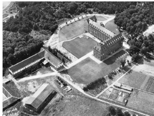
Missiehuis St. Paul, gebouwd in 1912-14 en afgebroken in 1978. In 1974 werd een kleiner klooster gebouwd. (zie briefkop)

Intussen ontwikkelde er zich een groot landbouw- en veebedrijf met diverse werkplaatsen waar veel broeders werkzaam waren. Tegen het einde van de 2 de wereldoorlog werd St. Paul getroffen door 88 granaten, maar wegens de robuuste constructie van het gebouw stond het missiehuis als geheel nog overeind. De schade was het grootst op de talrijke plekken op het dak en in de muren waar de granaten hadden ingeslagen en gapende gaten hadden achtergelaten.