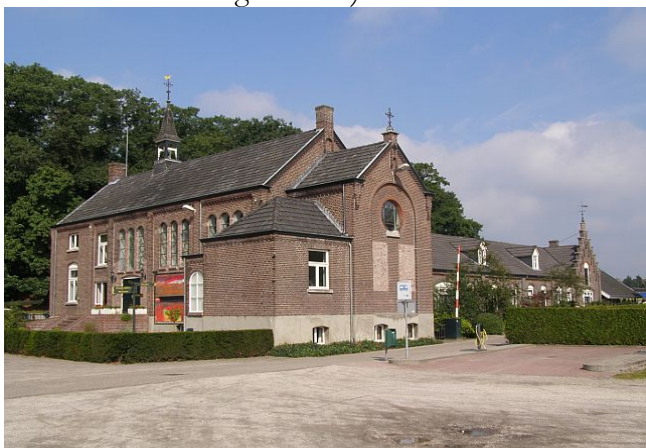
Oud St. Paul 1911 pachtershuis met nieuwe kapel