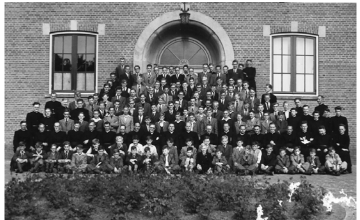
St. Paul in de hoogtijd rond 1950

wel ongeveer tegen 200 inwoners onderdak hebben gevonden. Maar voorlopig was het aantal inwoners nog klein totdat het schooljaar in september 1945 weer normaal op gang zou komen.