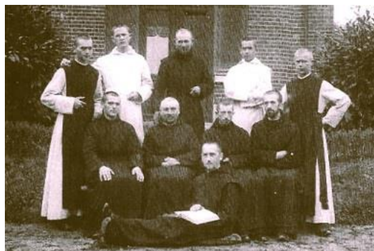
Eerste gemeenschap van St. Paul na 1211

Het oorspronkelijk vanuit Zuid-Afrika gestichte St. Paul op het uitgestrekte landgoed Klein Vink was bedoeld als een opleidingshuis voor missionarissen hoofdzakelijk voor Afrika. De levensstijl van de jonge kloostergemeenschap was uiterlijk nog een voortzetting van het oorspronkelijk Trappistenklooster in Mariannahill in Zuid-Afrika wat betreft kleding en liturgie.