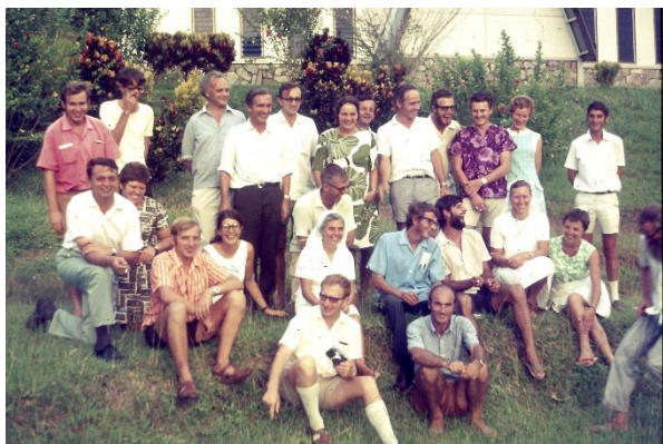
Het missiepersoneel in het bisdom Lae rond 1970

Rond 1950: St. Paul was tot de nok toe bewoond met meer dan 200 personen, broeder aspiranten, studenten voor priesteropleiding, postulanten, novicen, paters, broeders, allen hadden hun plek op het 175 hectaren landgoed van Klein Vink.